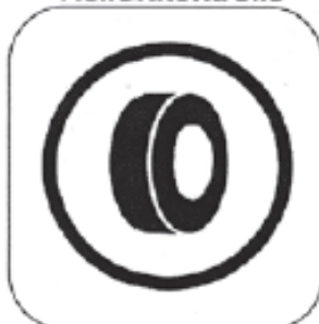
Anfang der Reifenmarkierung / Reifenkontrolle

Farbe Hinweis auf Posten: GELB Farbe Kontrollposten: BLAU