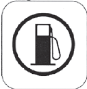
Anfang der Tankzone

Farbe Anfang der Kontrollzone: GELB Farbe Kontrollposten: ROT