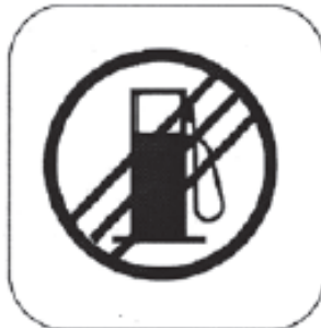
Ende der Tankzone