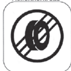
Ende der Reifenmarkierung / Reifenkontrolle