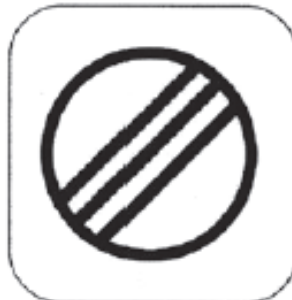
Ende der Kontrollzone