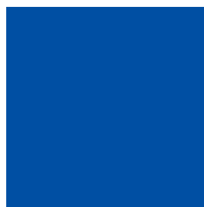
Echtfarben Pantone Pantone 661 CVU