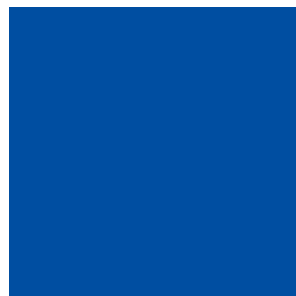
Folien Mactac MACall 9899-26