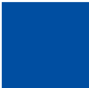
Europa-Skala Vierfarbsatz C:100 %, M:80 %, Y:0 %, K:0 %